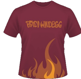
Pfadi Windegg T-Shirt 20 Fr.

Wichtig: Sämtliche Artikel aus dem Pfadi-Shop «Hajk» ( www.hajk.ch ) können über die Materialstelle der Pfadi Windegg günstiger bezogen werden.