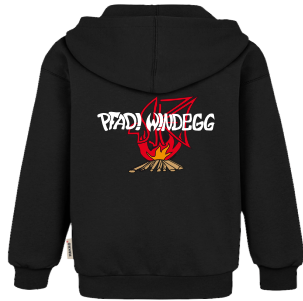
Pfadi Windegg Zip-Pullover 60 Fr.