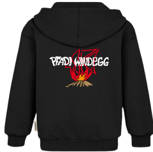
Pfadi Windegg Zip-Pullover 60 Fr.