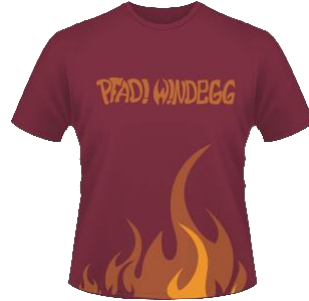
Pfadi Windegg T-Shirt 20 Fr.

Wichtig: Sämtliche Artikel aus dem Pfadi-Shop «Hajk» ( www.hajk.ch ) können über die Materialstelle der Pfadi Windegg günstiger bezogen werden.